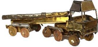
Stor lastbil af blik med kunstfærdigt styretøj