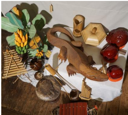
Træskærerarbejde og bambusinstrumenter