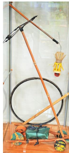
Tre slags trilleværk – Bil med skubbestang, trillebånd og propel-trilleværk af plastbøtter, badesandaler, grene og hjuldæk