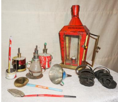
Lamper & øser af blik og sandaler af bildæk