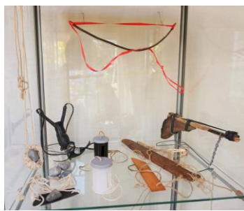
Sving-instrumenter, tændstikpistol, slynge & slangebøsse af gavebånd, træ, snor & cykelslange