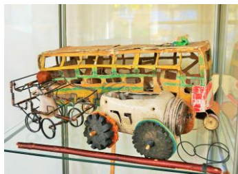
Biler & bus lavet af pap, ståltråd, plastbøtte & hjul af badesandaler