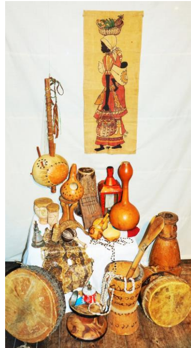
Tekstiler, skind, trommer, instrumenter, husgeråd & lamper af blik, træ & kalabas