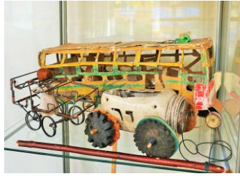
Biler & bus lavet af pap, ståltråd, plastbøtte & hjul af badesandaler