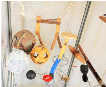
Bolde, snurrebasser og andet motorisk bevægelseslegetøj af div materialer