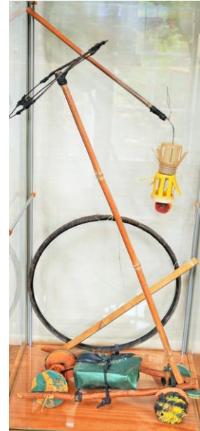
Tre slags trilleværk – Bil med skubbestang, trillebånd og propel-trilleværk af plastbøtter, badesandaler, grene og hjuldæk