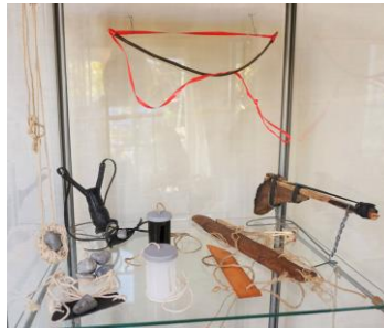
Sving-instrumenter, tændstikpistol, slynge & slangebøsse af gavebånd, træ, snor & cykelslange